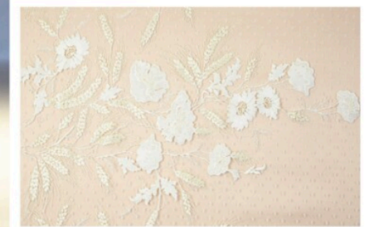
Broderi på silketyl vinder mere og mere frem i disse år, oplever Susse Thorseng Lærche.

Kjolen her er designet af Susse Thorseng Lærche til Skredderlaugets 75 års jubilæumsopvisning. Dette er hendes bud på en vinterbrud anno 2019/2020. Kjolen er lavet af en tung viskose crepe. Kåben, som modellen bærer over armen er lavet i et miks af uld og silke.